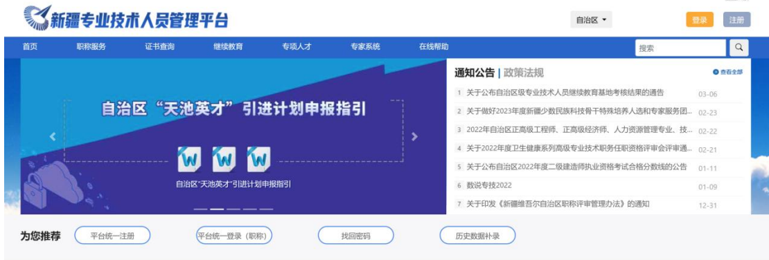
图例：自治区网站首页查询