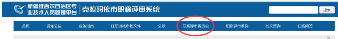
图例：地州首页查询